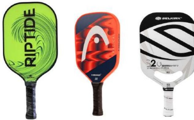
Imatges de referència.