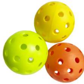
Imatges de referència.