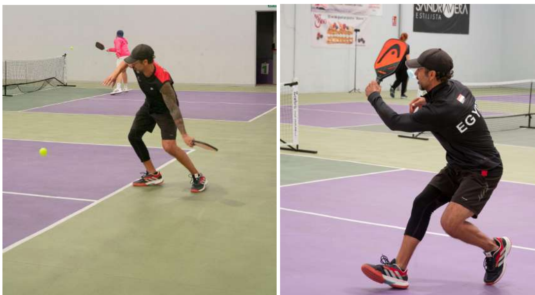
Imatges de referència. Vila Pickleball Sabadell