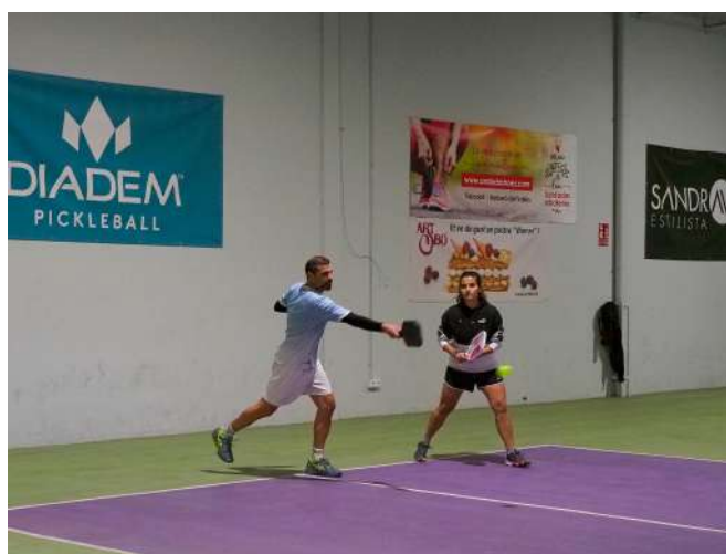
Imatges de referència. Vila Pickleball Sabadell