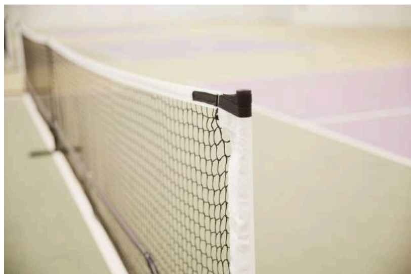
Imatges de referència. Vila Pickleball Sabadell